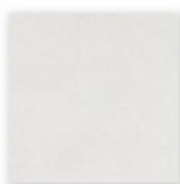
DAR4H722 Série EXTRA dlaždice slinutá, glazovaná 45 x 45 cm, bílá