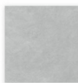
DAR4H723 Série EXTRA dlaždice slinutá, glazovaná 45 x 45 cm, světle šedá